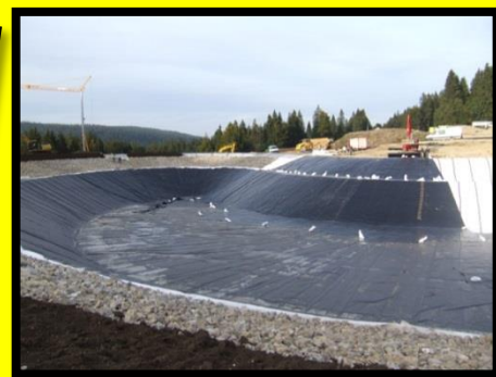
Retenue Collinaire – Lamoura – Les Rousses – 2008