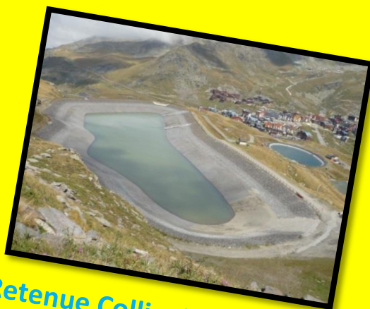
Retenue Collinaire - Les Deux Lacs – Val Thorens - 2009