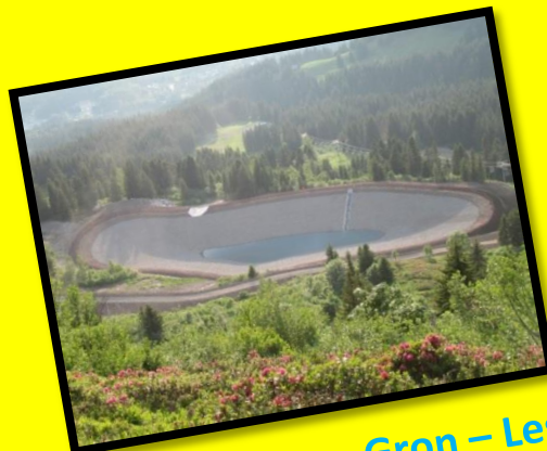
Retenue Collinaire - Gron – Les Carroz – 2013