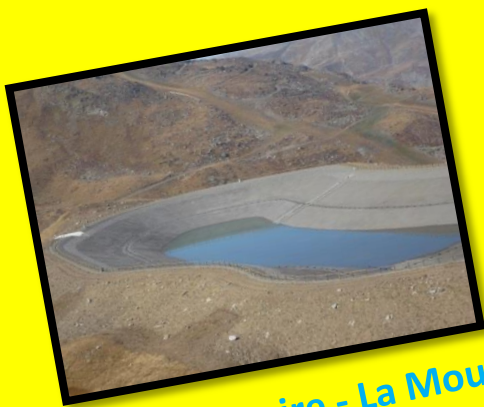
Retenue Collinaire - La Moutière – Val Thorens - 2009