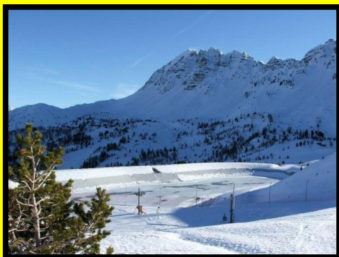
Retenue Collinaire - Chabrières – Vars – 2010