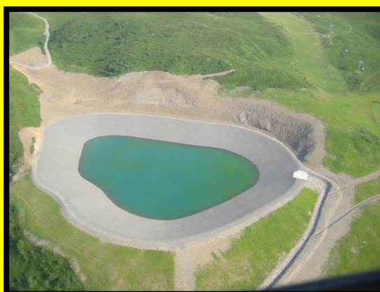
Retenue Collinaire – Le Grand Bornand – 2006