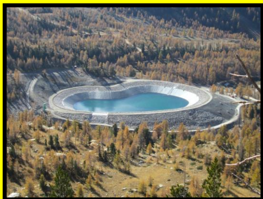
Retenue Collinaire – Gourc de la Peur – Isola 2000 – 2014